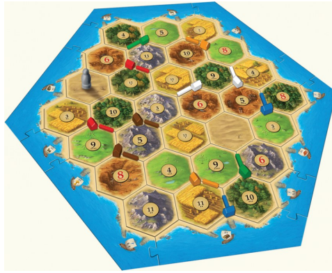
Abbildung 1: Beispiel einer Aufstellung für 5-6 Spieler 1 .